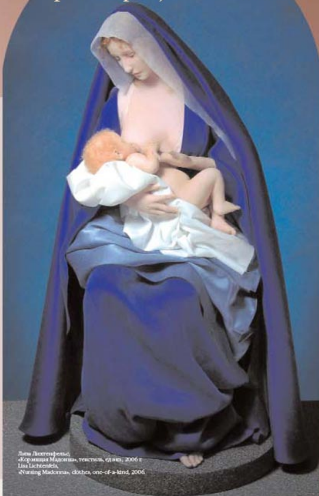
Лиза Лехтенфельс, «Кормящая Мадонна», текстиль, ед. экз., 2006 г. Lisa Lichtenfels, «Nursing Madonna», clothes, one-of-a-kind, 2006