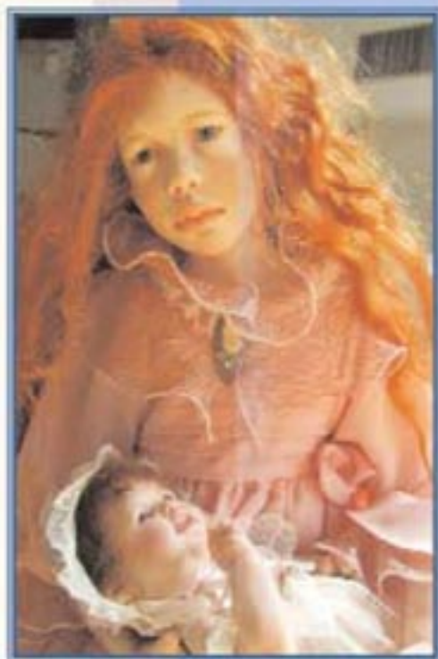
Кукла Джиофрини Трани (Италия). The doll by Giuseppina Trani (Italy).