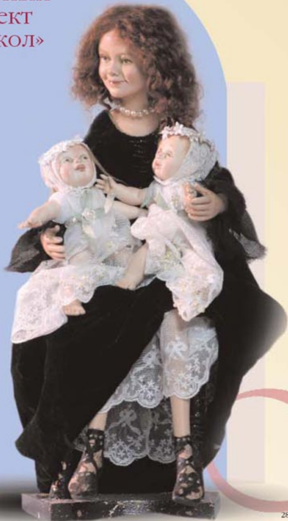
Светлана Дубодел (Россия), «Ощастье», композиционный материал, около 40 см, ед. вы., 2006 г. Svetlana Dubodel (Russia), «Happiness», composite, about 40 cm, one-of-a-kind, 2006.