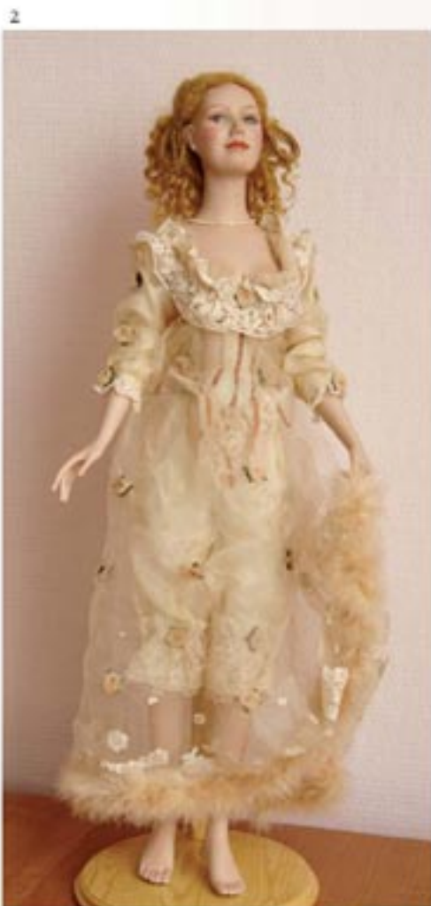
1. Кукла Светлана Никольская. Doll by Svetlana Nikol'skaya.

In this issue of the «Doll World» magazine we present the works made by the famous Russian doll artists especially for the project.