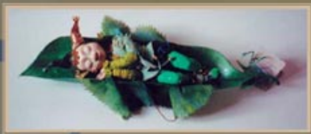
«Шут гороховый», Felt, текстиль, 30 см в длину, 2005. «Balloons», felt, cloth, 30 cm longwise, 2005.