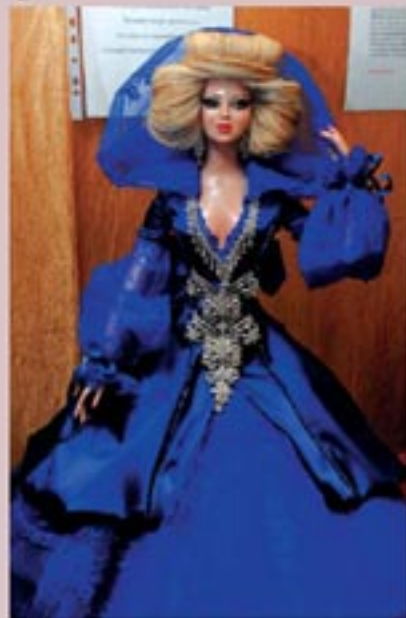
3. Кукла Филиппа Киркорова The doll by Philip Kirkorov