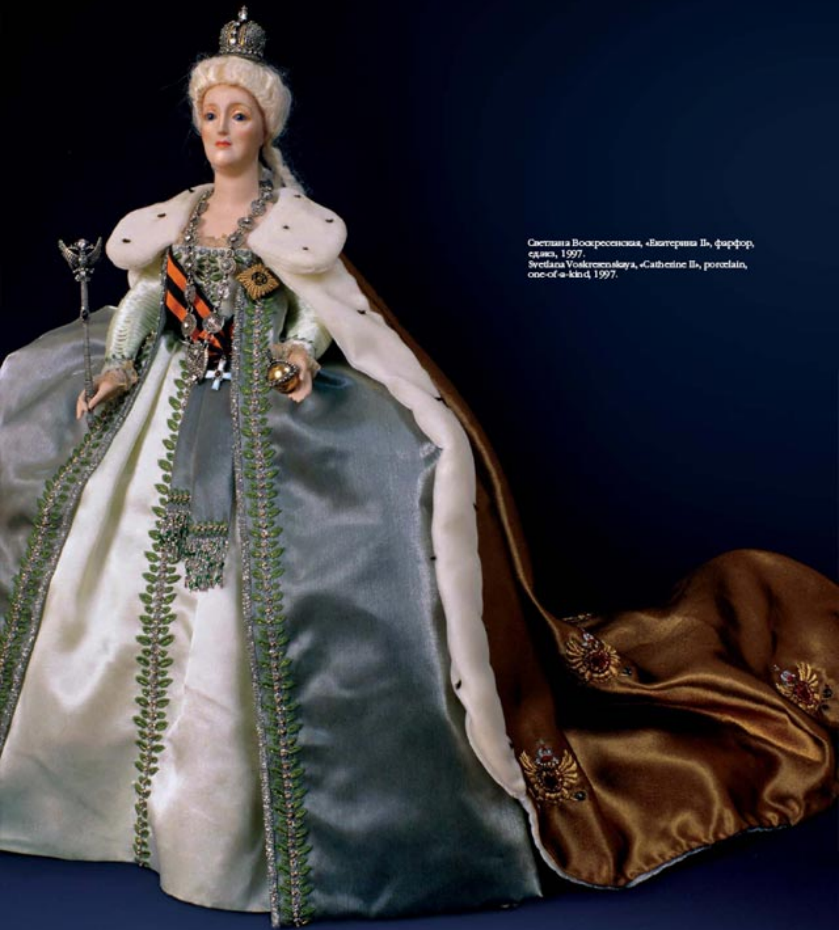
Светлана Воскресенская, «Екатерина II», фарфор, едина, 1997. Svetlana Voskresenskaya, «Catherine II», porcelain, one-of-a-kind, 1997.