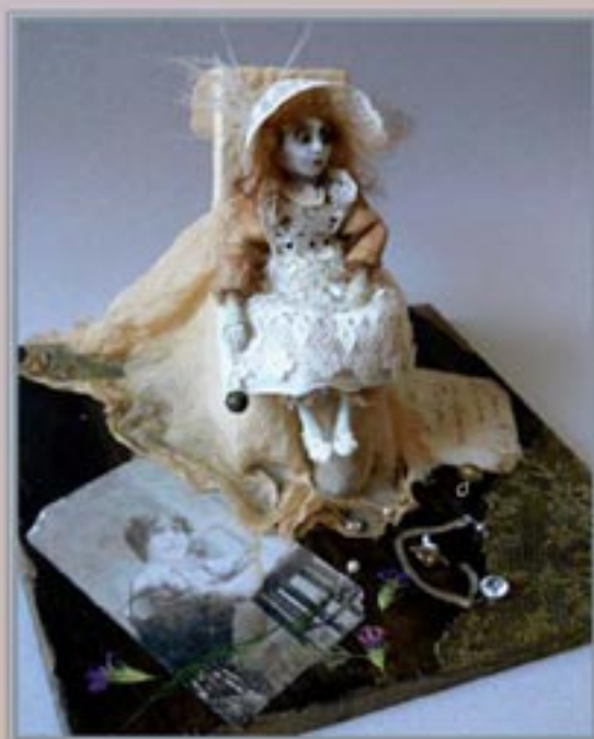
«Забыванная кукла», Фимо, антикварный текстиль, дерево, принт, 12 см, 2006. «Forgotten doll», fimo, antique cloth, wood, print, 12 cm, 2006