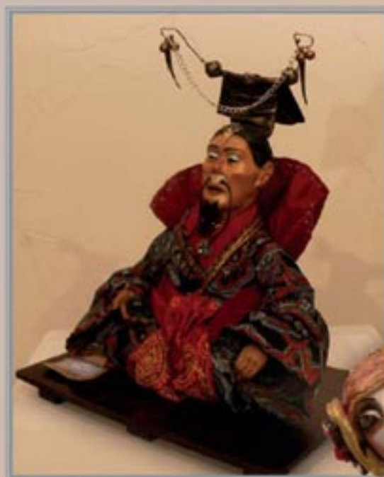
«Сын Неба», Modelin, антикварный шур, кожа, дерево, 17 см, 2006. «Son of the Sky», Modelin, antique moire, leather, wood, 17 cm, 2006