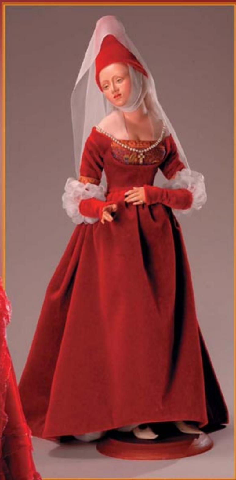
Алла Бельяева, "Луcretia", фарфор, ограниченный тираж Alla Belyaeva, "Lucretia", porcelain, lim- ited edition