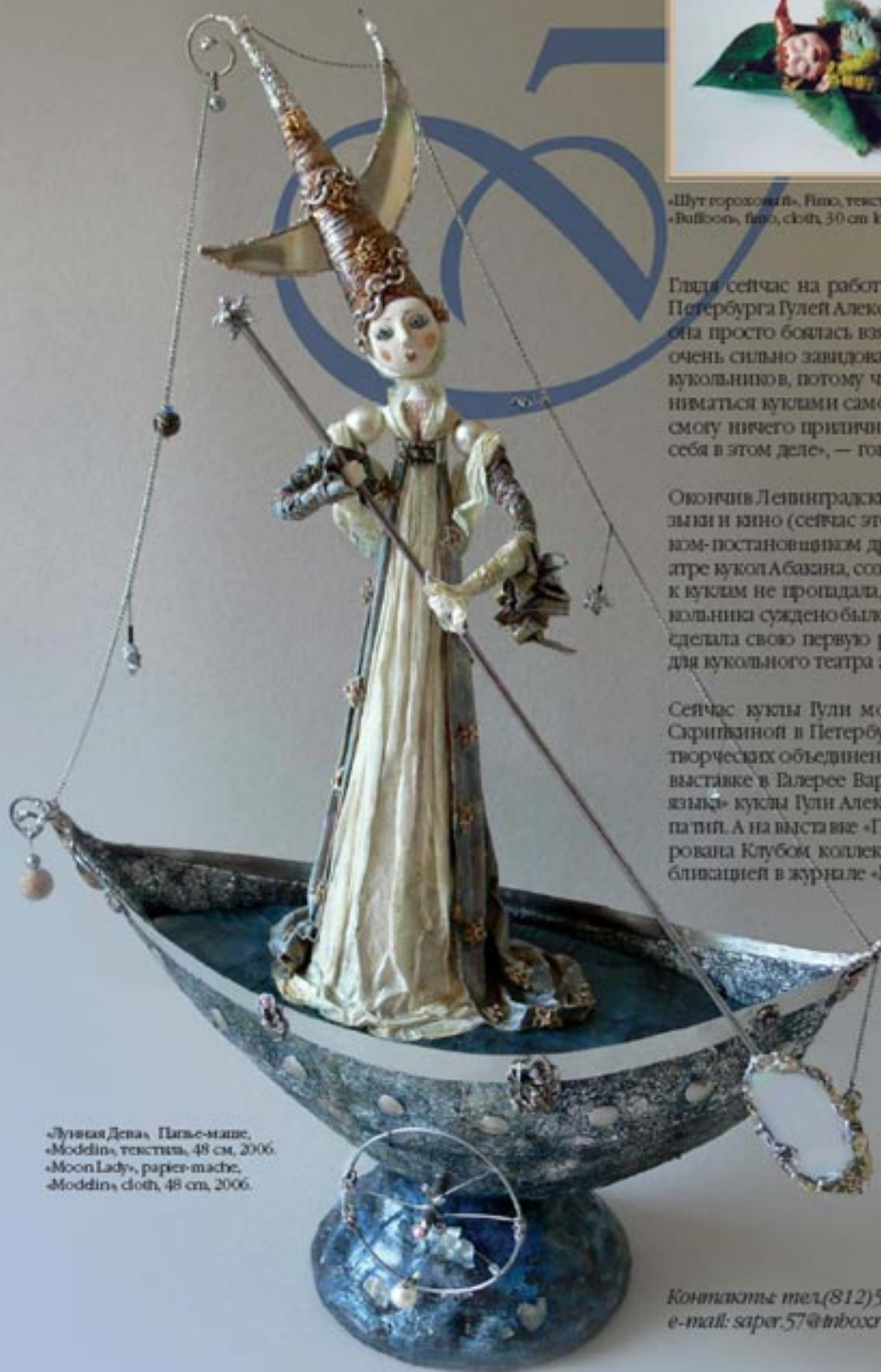
«Лунная Девка», Papier-mache, Moddin, текстиль, 48 см, 2006. «Moon Lady», papier-mache, Moddin, cloth, 48 cm, 2006.

Контакты тел.(812)579-73-15, 8-906-242-48-66, e-mail: sapor.57@inbox.ru