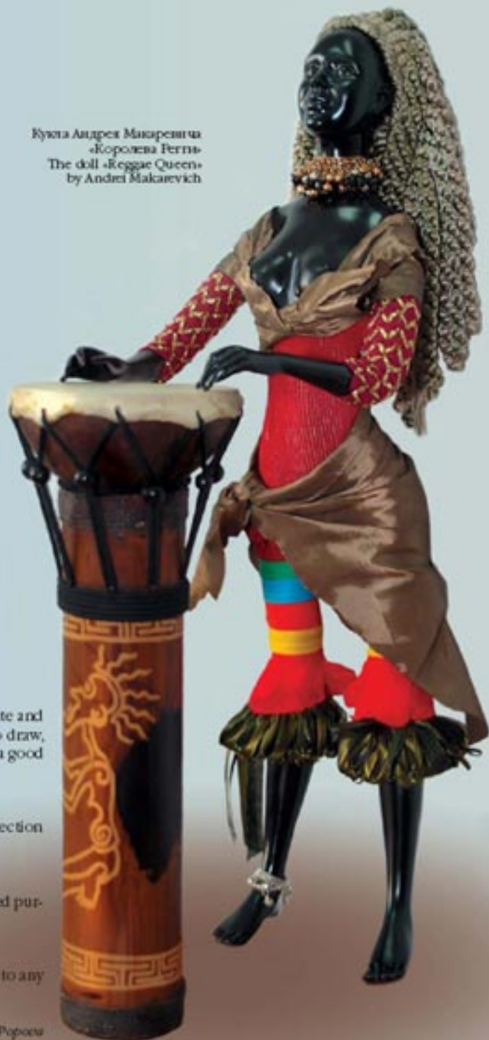
Кукла Андрея Макаревича «Королева Регги» The doll «Reggae Queen» by Andrei Makarevich

How was this image born? Have you made a sketch?